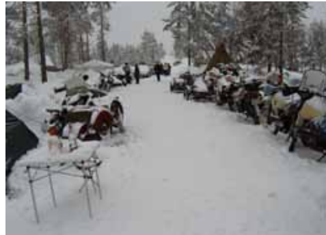
Et kig ned af "main street"

dem alle. Det sneede en del men det var ikke koldt.