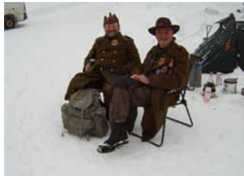
To gæve nordmænd som rigtig hyggede sig