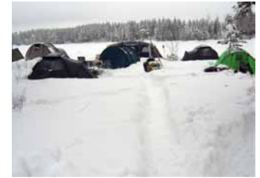
Vores lejer set fra "main street"

I Oslo var der i denne weekend faldet 60 cm sne, det kunne vi fornemme da der også var meget der hvor vi befandt os, det sneede i næsten to dage. Det var hyggeligt.