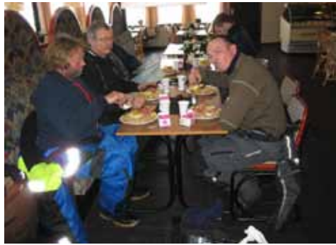
på udekøkken i frost grader skal man kun tage på hvis man kan lide dette. Jeg havde en god tur.