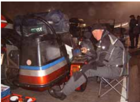
Aftens maden bliver lavet og indtaget til stor forundring for bilisterne som holdt omkring os