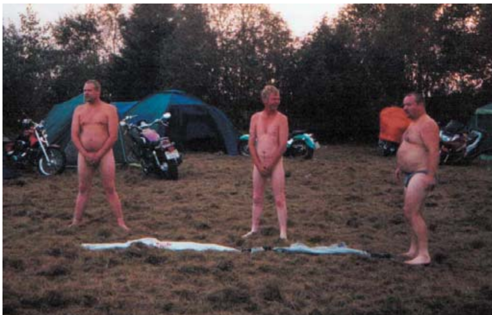
Det andet hold vandt med næsten to meter men de smed til gengæld også alt.