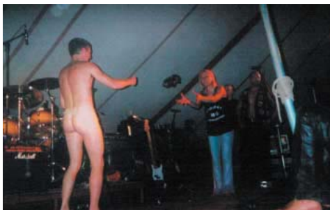
Det sidste tøj ryger.