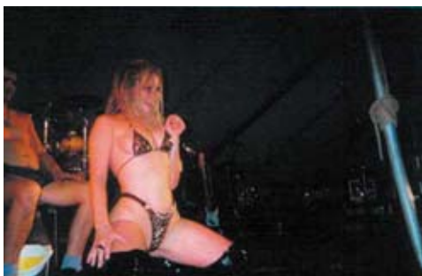
Den ægte vare.

jeg ved hvor meget hun snorker så jeg ville hellere sove i mit eget telt på den hårde jord. Om eftermiddagen var der to professionelle strippere ude på pladsen og de så rigtig godt ud. Om aftenen mindede jeg far på at han året før havde sagt at han kunne strippe bedre end dem der gjorde det sidste år så vi gik op og fik ham meldt til. Han skulle kæmpe mod fire andre og vandt en sweetshirt