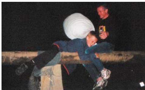
Pudekamp ved Humle træf.

Til dette træf kom der masser af Tyskere og der var konstant en motorcykel som lavede brænder eller en cykel som var gasset så meget op at tændingsbegræns-eren slog til. Da vi havde slået telte op og pumpet luftmadrasser ville jeg lægge min luftmadras ind i mit telt og så opdagede jeg pludselig at der kom en 10 cm åbning i min luftmadras. Den kunne desværre ikke repareres så den blev smidt væk. Far tilbød mig at vi kunne bytte plads så jeg kunne sove hos Alice men