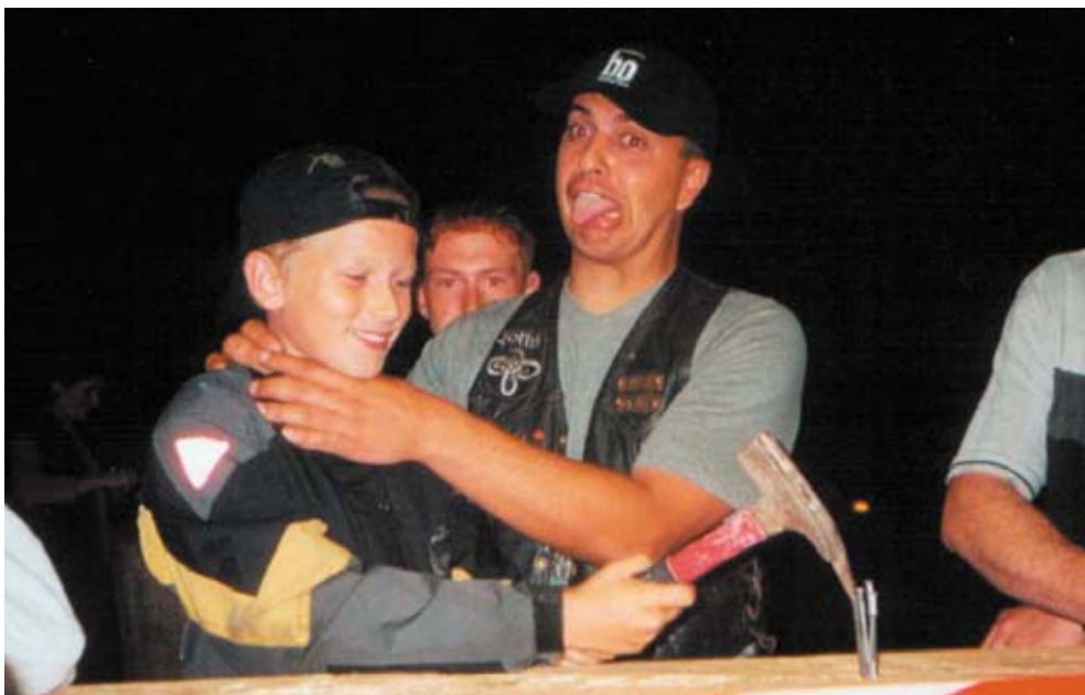
En dårlig taber i søm.

Dette var et af de træf jeg havde glædet mig meget til og det blev da også alle tiders, så der vil jeg også gerne med til næste gang. Om eftermiddagen var der konkurrencer og far og jeg skulle selvfølgelig være med. Den første konkurrence var ringridning og her fik vi en andenplads, den anden konkurrence var om at køre så langsomt som muligt og her fik far en andenplads og jeg fik præmien for det. Vi slog en masse søm men ikke ligesom vi plejer for det foregik med en hammer med kardanled og meget min-