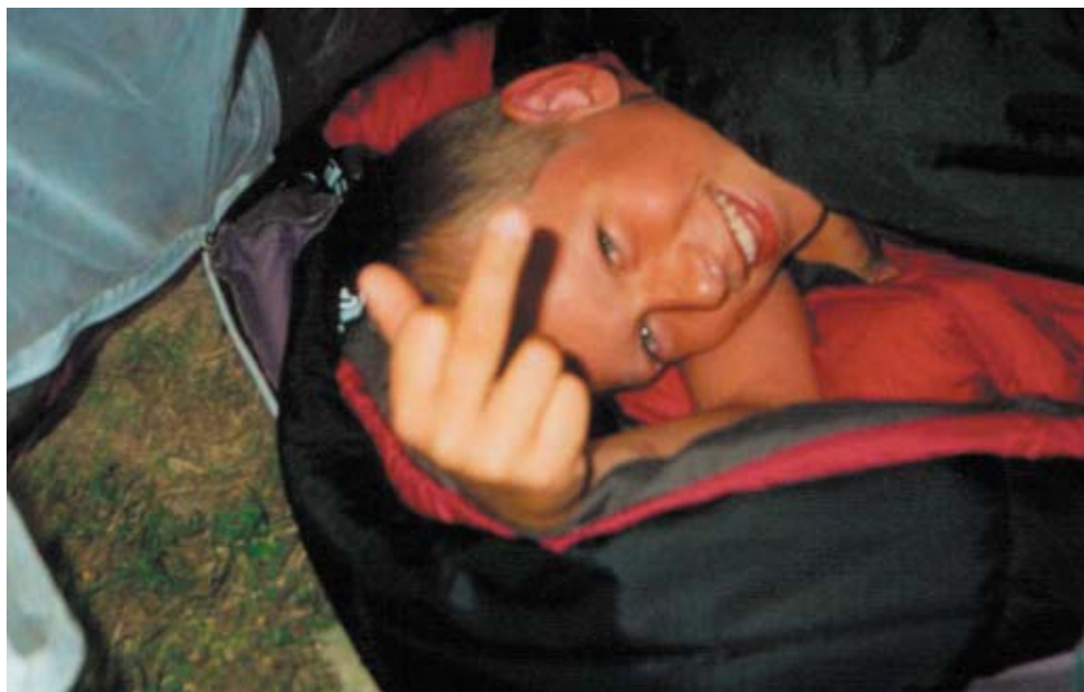
Fuck dig doooo.