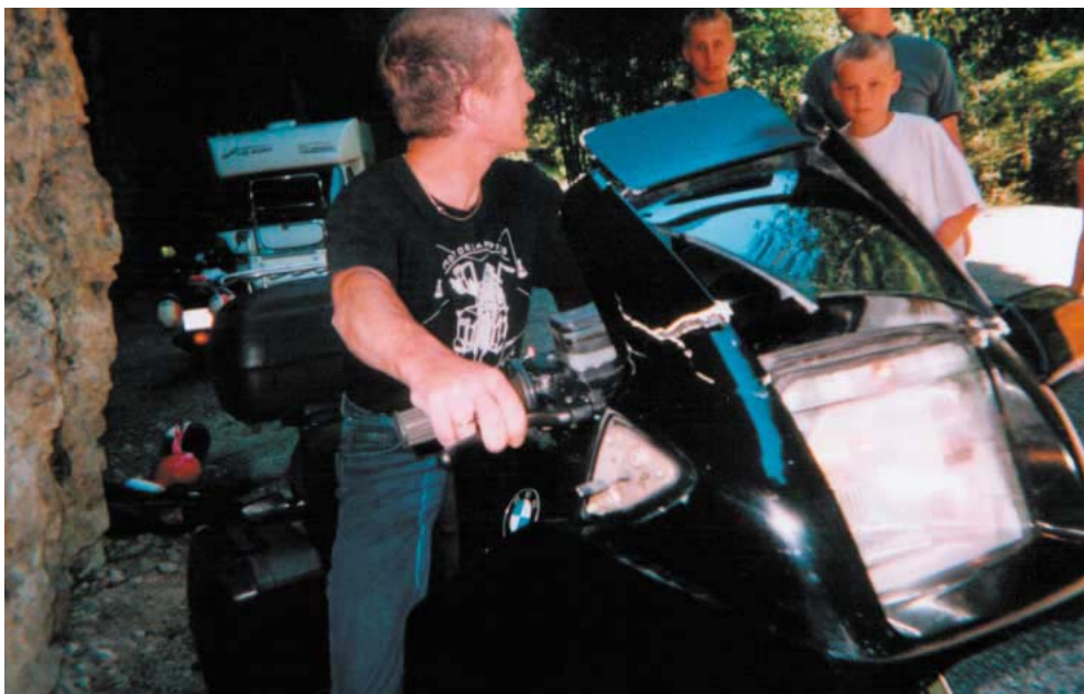
Fatter baldrer bimmeren.