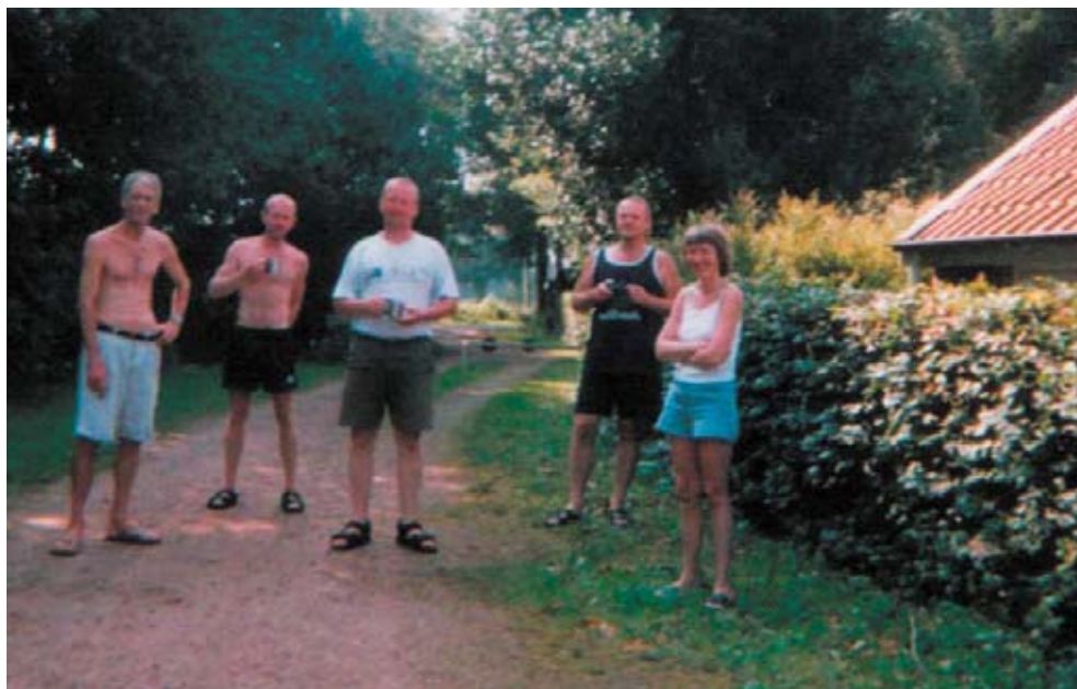
Vennerne på blue-star.