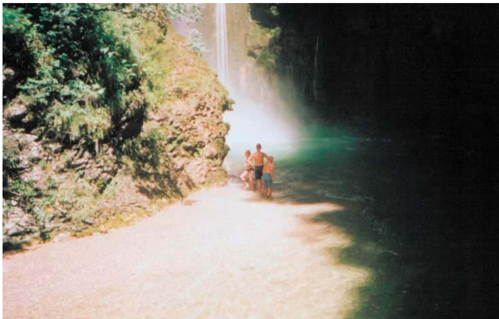
Badning ved vandfald.

var at Alice smed Suzukien. Der kom straks nogen og ville hjælpe med at få cyklen op at stå og gjorde Alice opmærksom på at de da synes det var en pæn cykel inden hun smed den. Der knækkede heldigvis kun et blinklys, kåben var vist knækket i forvejen da hun smed Suzukien udenfor campingpladsen sidste år. Da vi havde fået teltene slået op gik vi i soveposerne og sov rigtig godt efter en 16 timer lang dag. Dagen efter slappede vi bare af og de gamle bællede øl som jeg aldrig har set mage til før og så spillede vi også Uno men far havde vist svært ved at koncentrere sig om spillet, jeg tror han var blevet svimmel af at bære flasker væk. Da vi vågnede næste dag havde far det meget bedre og nu synes han at jeg skulle ud og se en masse flotte veje så vi kørte op i en masse hårnålesving og far kørte helt ud til kanten så han var sikker på at jeg