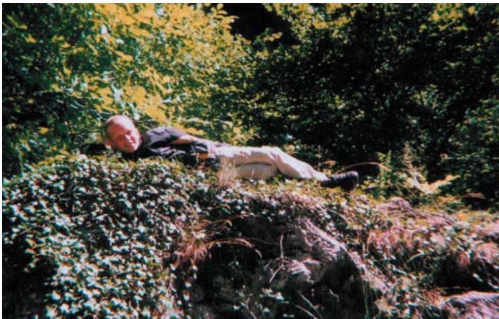
Artiklens forfatter i færd med IKKE at få stress.

deres toiletter for de er lavet sådan at når man har været ude og gøre stort får man fuld fornøjelse af det. Det hele ligger simpelthen på en hylde og hørmer så det er nok ikke ret mange Hollændere der gider at sidde og læse på toiletterne. Jeg prøvede et spil i Holland som er lige så almindeligt der, som ludo er der