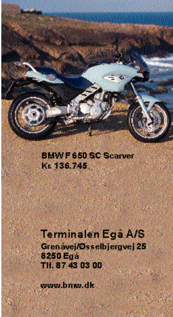
BMW F 650 SC Scarver Kr. 136.745

Terminalen Egå A/S Grenåvej/Øsselbjergvej 25 8250 Egå Tlf. 87 43 03 00