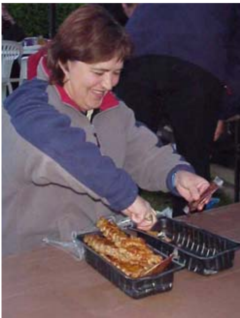
Tilberedning af grillmad

"Grillerne" blev klare, og alle fik arrangeret deres medbragte grillmad på ovnene, der var alt fra grill spyd, oksekød, kylling, revlsben og tun bøf med diverse tilbehør. Drikkevarer var der tilsyneladende også nok af, med undtagelse af, at undertegnede havde fået en for