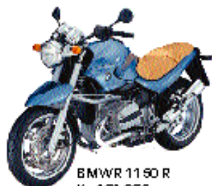
BMW 1150 R Kr. 161.265