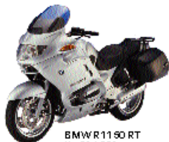
BMW 1150 RT Kr. 214.921