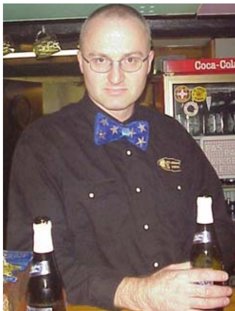
Bartenderen i fuld ornat med lys i propellen.