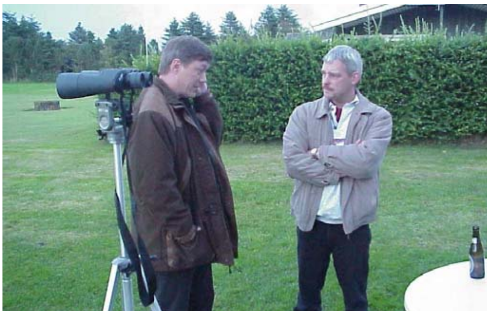
Kikkert til havudsigt