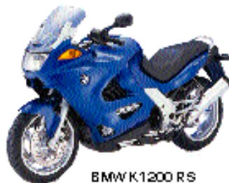
BMW K1200 RS Kr. 230.295