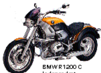
BMW 1200 C Independent Kr. 209.284