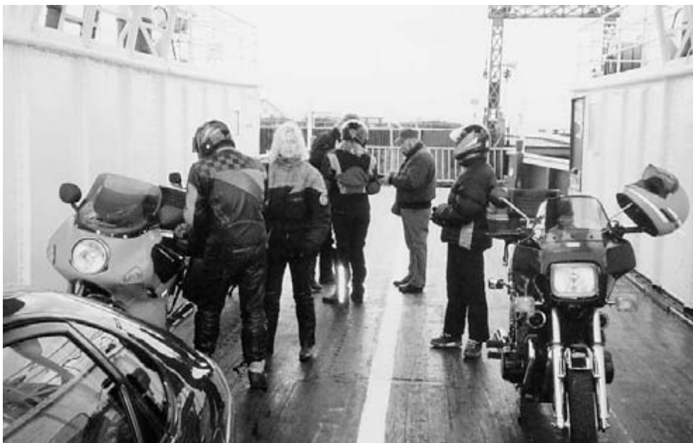
Færgen ved Udbyhøj.

Der blev kørt tæt og hurtigt. Ikke alle huskede at se sig for når de skiftede bane. Der blev også hurtigt fyldt op omkring klubhuset da vi kom dertil. Nydeligt hus med fine udenomsarealer de kunne benytte til teltplads. Flinker mennesker, de ulve. Og så laver de god mad. Skinkestege mellem to sengebunde, marinerede og overhældt med rødvin. Super.