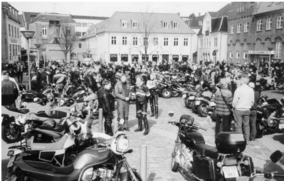
Torvet i Ålborg.

Vejen hjem var lang og drøj. Det lignede en hel dans hen over asfalten med sidevind der flyttede på cyklerne. Støvstorme fra markerne nedsatte sigtbarheden til 0 og bagefter havde man knasen mellem tænderne.