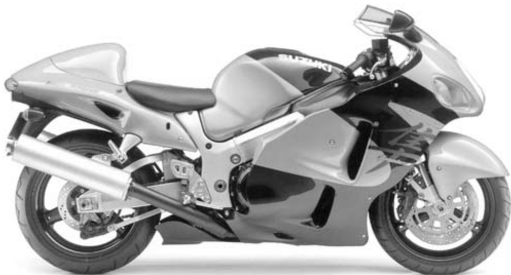
GSX 1300 R HAYABUSA

Randersvej 36 - 8200 Århus N - 86 16 33 96