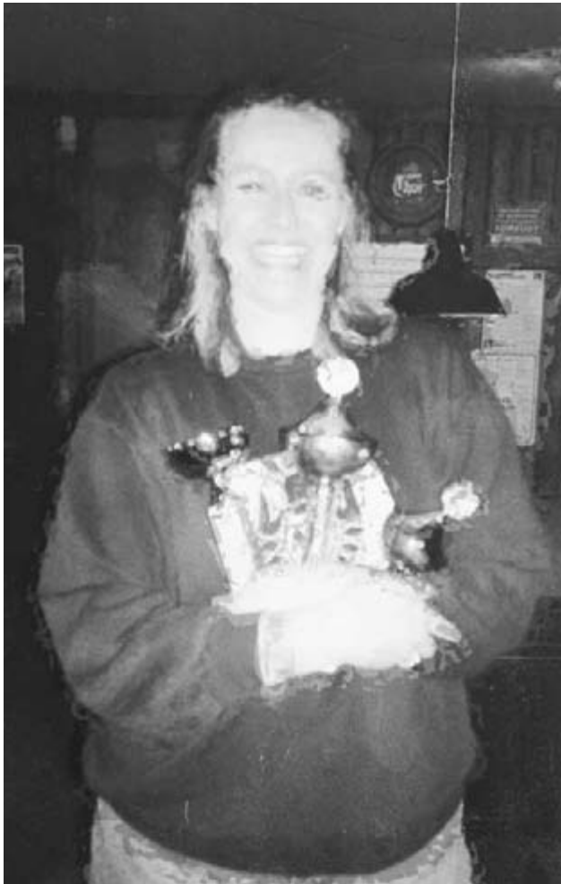
Et tillykke med de mange pokaler og tak for bekendtskabet.