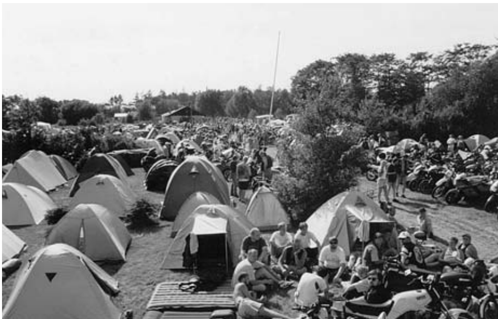
De kom og kørte frem og tilbage. Vi var der kl 15 og havde nr 1386. Der var MC'er overalt.