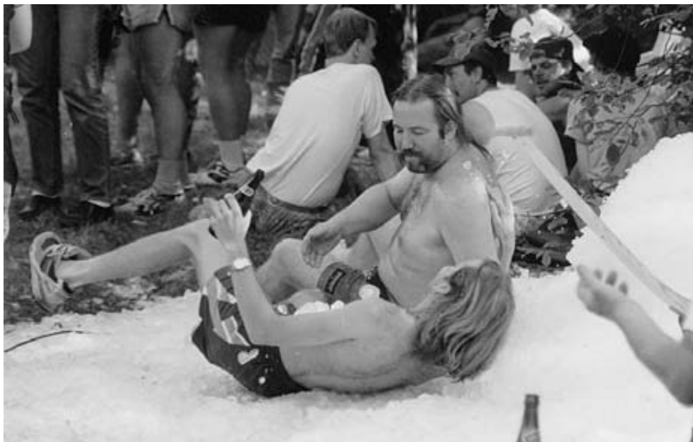
En stor bunke is på en varm dag kan få folk til de mærkeligste ting.

hjem, der skal der skrues, så hellere komme af med den mens der er liv tilbage i den.