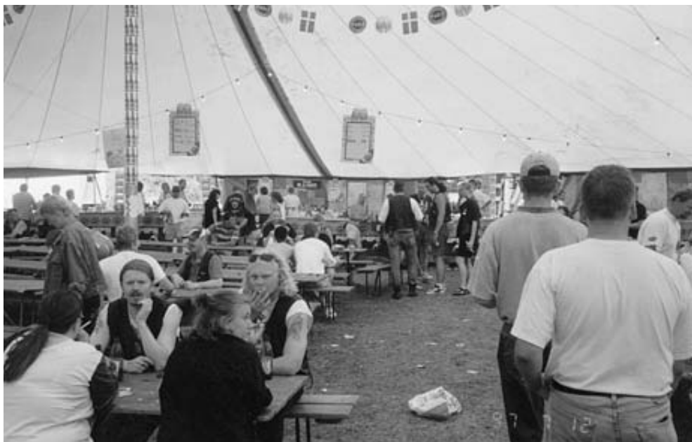
Spiseteltet er jo enormt.

Afsted det gik. Vejret var jo herligt men allerede efter Ålborg undrede det mig at motorcyklerne var på vej sydpå. Og det blev ved. Ja, det var da meget rart at have nogle at hilse på. Jeg hilser på alle der kommer imod mig lige fra MZ til Harley (for at nævne de to yder-