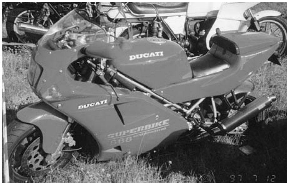
Svensk Ducati 888 gravet ned til svinggafflen.

anderledes. Der var jo den sædvanlige skraben sammen af underligt udseende Harley'er. Udbyggede, tilbyggede og ombyggede, og selvfølgelig er der altid nogen der skal overdrive. Jammen, fy for satan, havde det været mit badedyr havde jeg holdt op med at puste for længe siden. Det der undrede mig noget var hvorfor der ikke stod NIVEA henover hovedet på hajen (og hvorfor den underlige motor ikke er dækket af plastic for den pynter da ikke).