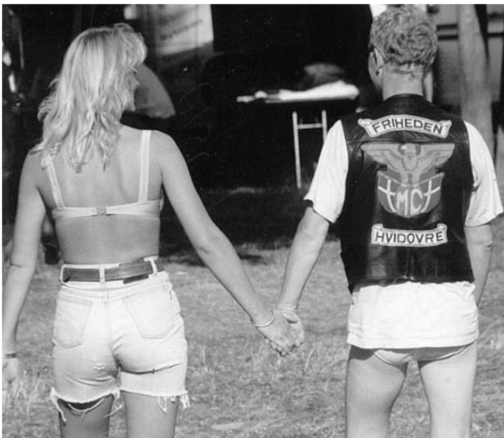
"Når man er Rocker går man altid med vest på".